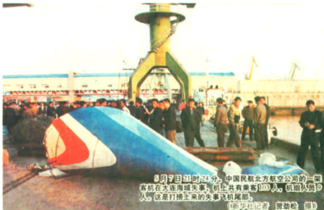
5月7日21时24分，中国民航北方航空公司的一架客机在大连海域失事，机上共有乘客103人，机组人员9人。这是打捞上来的失事飞机残骸。

新华社大连5月8日电 (记者张晓明 贺劲松 傅兴宇) 截止到今天下午，大批搜救人员和船只已陆续赶到位于大连港外侧海面的“5·7”空难现场，并展开了大规模的搜救行动。国家安全监督管理局副局长冯昌明今天在此间表示，下一步空难救援工作的重点是加紧进行遇难乘客遗体及失事飞机残骸的搜寻和打捞工作。冯昌明是在国务院“5·7”空难处理小组今天下午首次在此间举行的新闻发布会上说这番话的。他说，目前参与搜救行动除了大连本地的40余条船外，还有来自烟台的一条救助船、天津和海军的扫雷船以及由交通部专门调来的700吨大吊船，这些设备完全可以满足搜救行动的需要。11名潜水员已于今天早晨8时40分下水，并一直奋战在出事现场。冯昌明说，失事客机上共有乘客和机组成员112人，到目前为止，只打捞上来遇难乘客遗体66具。目前，搜救人员一方面继续寻找打捞遇难者遗体；另一方面，对打捞上来的遇难者遗体进行了妥善保管，分别安置在有关殡仪馆内，由法医进行鉴定；民政、公安等部门正在加快遗体的辨认工作。冯昌明希望乘客家属能够积极配合有关部门，提供乘客的体貌特征，以便加快遗体辨认工作的进度。另外，失事飞机的主体部分以及黑匣子仍未找到，捞上来的只是一些零星碎片。有关人士证实，失事客机为麦道82型飞机，1991年出厂，飞行时间为26700多小时。今天中午，新华社授权发布了“5·7”空难航班旅客的初步名单。冯昌明就此强调，详细的旅客名单正在进一步的核实当中。从名单核实的情况看，乘坐这次航班的旅客绝大部分来自辽宁、大连等地；也有来自西安杨森公司、交通部等单位的旅客；此外，还有日本旅客3人、韩国旅客1人、印度旅客1人、新加坡旅客1人、法国旅客1人，以及香港特区旅客1人。在新闻发布会上，冯昌明及中国民航总局副局长杨元元还通报了空难救援及善后工作等其他有关情况。多家中外媒体记者参加了这次发布会。