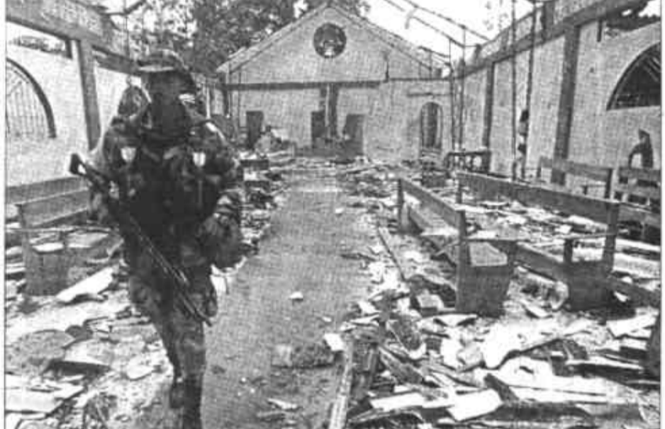
5月8日，哥伦比亚军警在乔科省博哈亚市日前被炸毁的教堂内巡逻。3日，在哥伦比亚国内不同派别武装力量的冲突中，一座教堂被炸弹炸毁，造成119名平民丧生。目前哥伦比亚已派出大量军警部队控制该地区的混乱局势。

长春黄金周里读书热 据新华社长春5月8日电（记者 马扬）“五一”长假，除旅游、购物，很多长春市民选择了去书店或图书馆，度过一个愉快的“读书节”。 几天来，长春市各大书店都出现了人满为患的景象。长春学人书店值班经理徐秀丽告诉记者，“五一”期间，来购书的人比4月同期增加了20%，销售码洋至少增长10%。在吉林省图书馆，前来借书的人照例爆棚。图书馆一楼“最新书屋”的一名管理员介绍，仅黄金周前4天，来书屋看书的市民已达到1000多人。长春市图书馆一楼大厅里的300多个阅览席位都坐满了人。该馆外借部主任说，5月1日，有530多人到图书馆借书，2日有570多人，到4、5日时，借书者每天都超过800人。