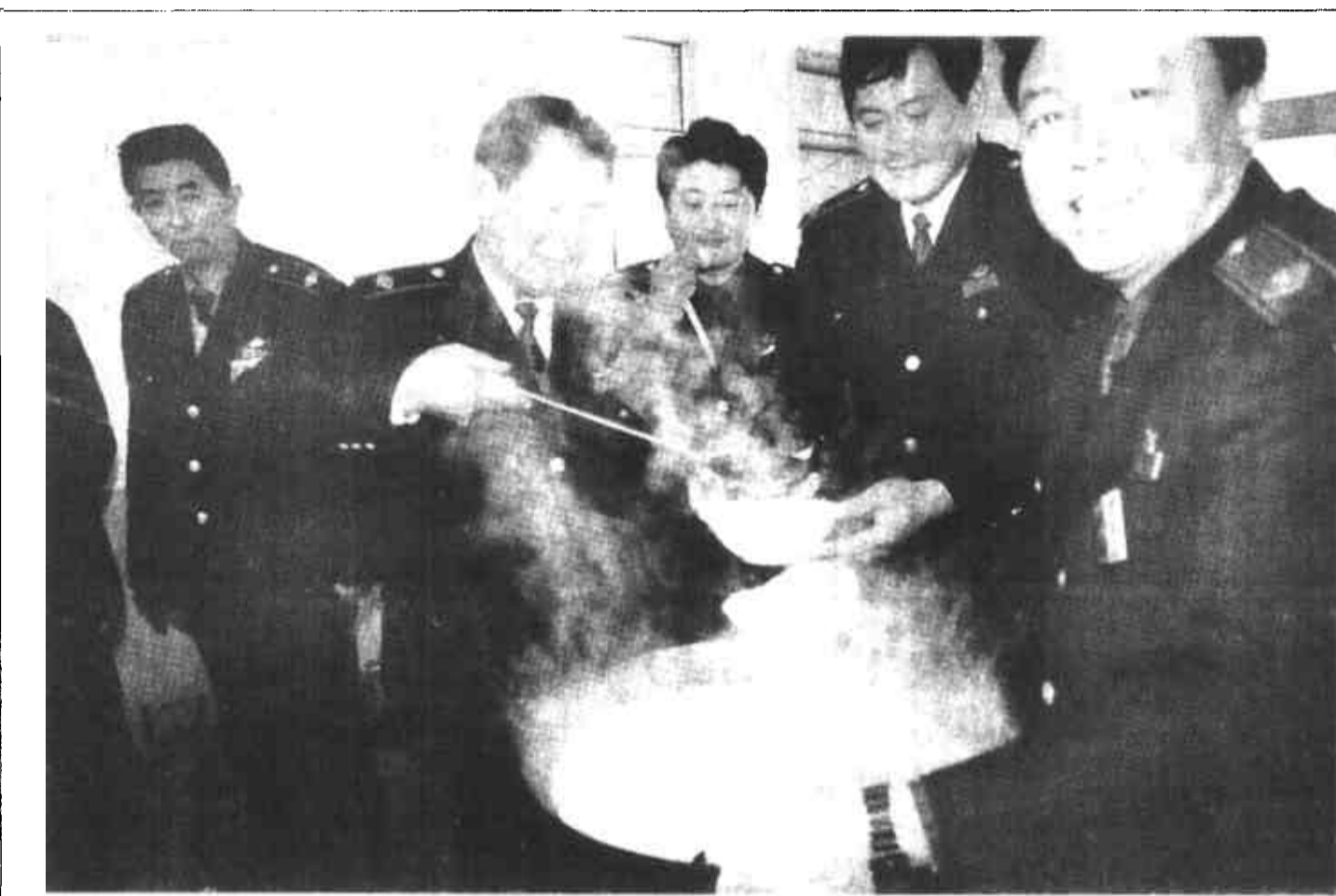
垦利县地税局局灶灶分局为提高廉政建设，开设了廉灶灶，所有地税干部同吃一锅饭，同喝一锅粥，有效地避免了请吃现象，使税收工作扎实有效。