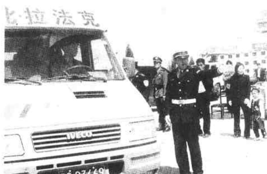
市交警直属一大队为确保辖区游客的安全和道路的畅通,“五一”黄金周期间,在辖区的天鹅湖、黄河水体现念碑、新世纪广场等旅游景点以及车站等游客密集的地方重点部署警力,保证了各条道路的安全畅通。他们文明、热情的服务态度赢得了广大游客的好评,树立了东营文明城市的良好形象。

利津讯 “五一”节日期间,利津县北岭乡七二村油料加工专业户郭洪山专程来到利津县供电公司北二供电所北二供电组,对他们半个月前深夜上门排除电路故障,避免了自己的经济损失表示感谢。 原来,两周以前的一个晚上,郭洪山的家庭油料作坊正在连夜赶一批油料加工活。因为客户急着用油,必须在第二天一早完成任务。可到了晚上12:00,500公斤大豆加温之后刚刚进入工作线,室内供电线路忽然出现故障,停电了。如果不及时修复电路,一方面会延误工期,另一方面停工时间超过1小时,大豆一降温,出油率也会下降20%,直接影响产量。 紧急时刻,郭洪山拨通了北二供电组的热线电话。原以为半夜三更的,电工们一定不愿出门,老郭也做好了下力气息求的准备。可谁想到,刚把情况讲清楚,电工组的值班人员就告诉他:“请稍等,电工马上到!” 不到半个小时,“全副武装”的电工已经进了油料加工作坊。仔细检查之后,很快找到了故障。不到10分钟,故障排除了,灯亮了,机器转起来了,老郭一家人脸上都露出了笑容。 因为电路修复及时,那一晚上郭洪山如期完成了加工任务,而且一点也没有减产。这不,趁着下雨天加工活儿少,老郭登门致谢来了。(蒲村)