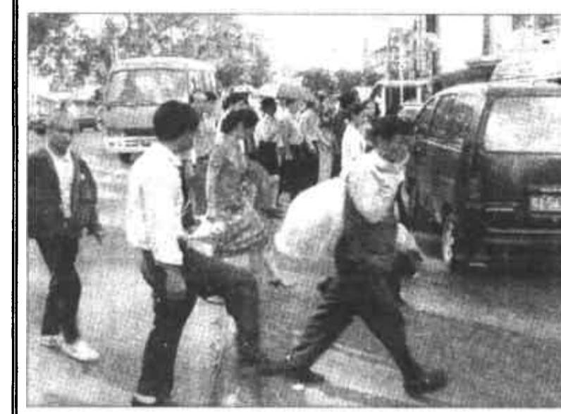
被誉为南宁市形象工程的朝阳路景观亮化工程于“五一”节前亮相。然而，道路隔离栏降低后，一天之内竟有6万人次违章“跨栏”。此事再一次提醒人们，精神文明建设需要每个公民从小事做起，大家才能共同生活在一个良好的社会气氛之中。

据新华社北京5月8日电（记者林红梅）中国北方航空公司一架麦道-82客机5月7日晚在大连港附近海域坠毁失事后，交通部立即组织专业救助力量，于今天凌晨3时赶赴出事现场全力救助。 据正在现场指挥救助打捞的交通部救捞局局长宋家慧介绍，截至15时15分，已经打捞起66具尸体。在水下探摸了6个小时的潜水员仍没有发现失事飞机，目前仍在继续搜寻之中。 获悉北方航空公司CJ6136航班失事后，交通部部长黄镇东及交通部救捞局局长宋家慧连夜赶赴大连，现场组织抢救行动。交通部烟台救助打捞局紧急研究制订抢救打捞方案，命令在旅顺值班待命的“烟救9”号和烟台基地待命值班船“德润”轮火速出动，投入救助。另外派一支由14名潜水员组成的潜水小分队也随同“德润”轮紧急赶赴大连。8日8时，“德润”轮载着潜水小组抵现场，布场后，潜水小分队立即编组，分批下潜探摸搜寻。 烟台救捞局已组织工程船“起重二号”、“烟救五号”和“烟救4”正在进行出航前的准备工作。