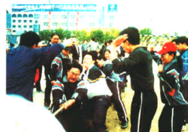
河口区建设局坚持利用节假日开展丰富多采的有利于干部职工身心健康的文体活动,即陶冶了干部职工道德情操,又增强了整体的凝聚力。图为近日举办的春季拔河比赛。