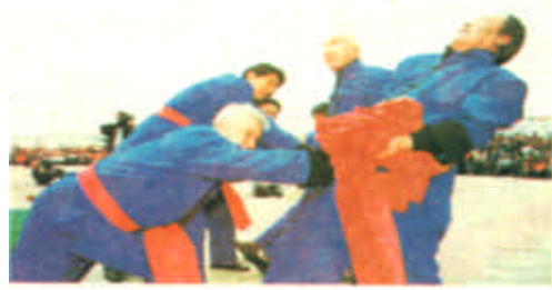
素有“海上神山”美誉的山东省长岛县渔民日前利用春季休渔期办起了以体验渔家生活为主题的“渔家乐”民俗旅游活动。这是岛上的老渔民在为游人表演《渔家号子》。

新闻热线 8328691 8331392 电子信箱 dyrb@sina.com 网址 http://www.dyrb.com 2002年5月10日 星期五 第48期 总第2704期 全国统一刊号 CN37-0054 邮发代号 23-172